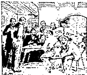
कार्ल मार्क्स और फ्रेडरिक एंगेल्स पेरिस के समाजवादियों और कम्युनिस्टों